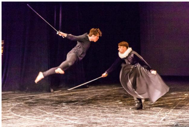
Сцена са шампионата сценских борби у Русији, почетак 21. Века